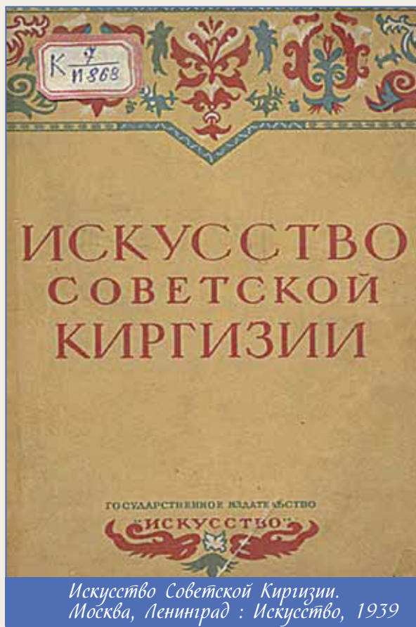
Искусство Советской Киргизии. Москва, Ленинград: Искусство, 1939

поэзии. Под влиянием его произведений была создана литературная школа Низами.